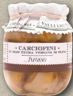
CARCIOFINI IN OLIO EVO 180 G