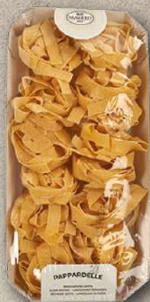
PAPPARDELLE ALL'UOVO 250 g