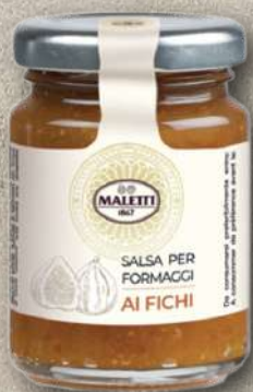
AI FICHI 110 g