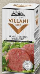
MINI COTECHINO 300 g