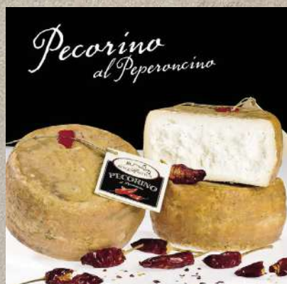
PECORINO AL PEPERONCINO 1.3 kg