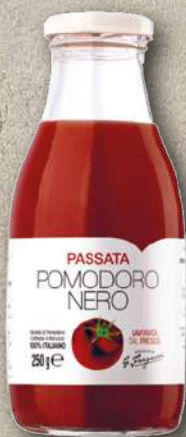
PASSATA DI POMODORO NERO 250 g