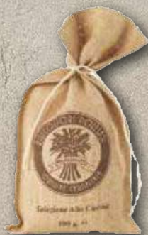
RISO CARNAROLI 500 g