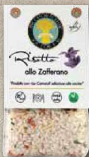
RISOTTO ALLO ZAFFERANO 300 g