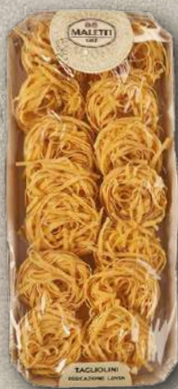
TAGLIATELLE STRETTE ALL'UOVO 250 g