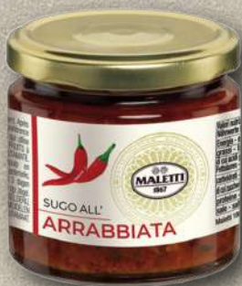
SUGO ALL'ARRABBIATA 180 G