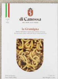
GRAMIGNA SEMI INTEGRALI 500 G