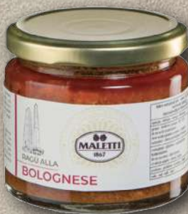
RAGÙ ALLA BOLOGNESE 180 G