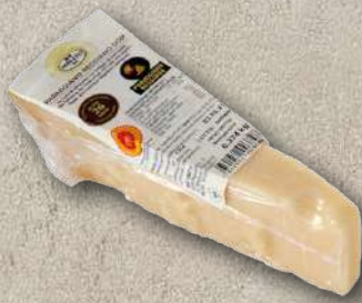
PARMIGIANO REGGIANO 18 MESI 350 g