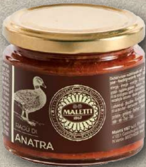
RAGÙ DI ANATRA 180 G