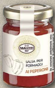
AI PEPERONI 110 g