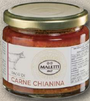
RAGÙ DI CHIANINA 180 g