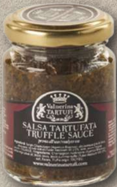
SALSA TARTUFATA 90 G