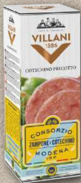
COTECHINO PRECOTTO IGP 500 g