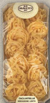
TAGLIATELLE ALL'UOVO 250 g