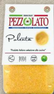
POLENTA GIALLA 300 g