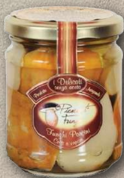
FUNGHI PORCINI AL FORNO 190 G