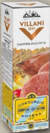
ZAMPONE PRECOTTO IGP MODENA 1 kg