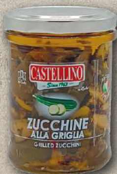
ZUCCHINE GRIGLIATE 180 g