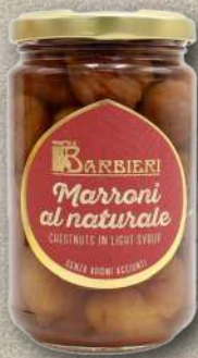
MARRONI AL NATURALE IN SCIROPPO LEGGERO 200 g