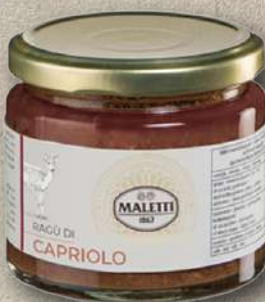
RAGÙ DI CAPRIOLO 180 G