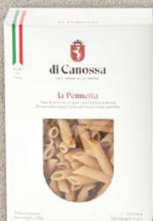
PENNETTE SEMI INTEGRALI 500 G