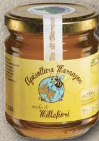
MIELE MILLEFIORI 250 g