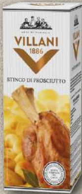
STINCO DI PROSCIUTTO AL FORNO 650 g