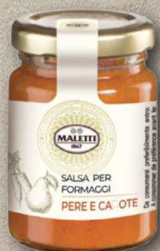
PERE E CAROTE 110 g