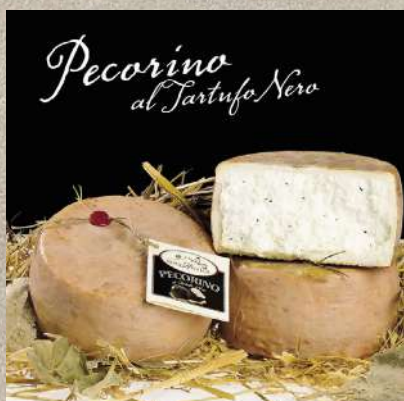
PECORINO AL TARTUFO 1.3 kg