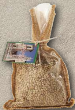
LENTICCHIE DEI MONTI SIBILLINI 250 g